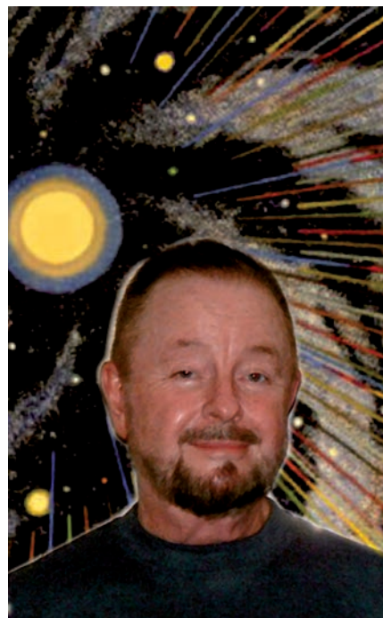
Le célèbre espion psychique devant une de ses toiles.